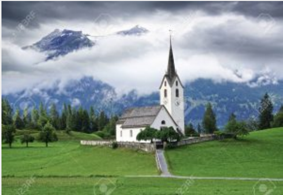
mountain landscape with church. Switzerland.